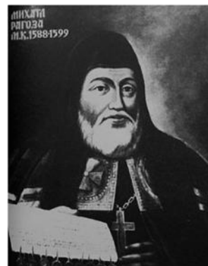
Kijevo metropolitas Mykolas Ragoza

Metropolitas Rutskis buvo įsitikinęs, kad atnaujinti Bažnyčią galima pirmiausia atnaujinus vienuolystę. 1617 m. įkurtas Bazilijonų Ordinas, kuris ilgą laiką buvo Unitų Bažnyčios atrama. Be vienuolinio gyvenimo ir pastoracinės veiklos (pvz., 1748 m. Lietuvoje veikė 60 parapinių vienuolynų bažnyčių su nuolatiniams pamokslininkais ir nuodėmklausiais) bazilijonai puoselėjo ir švietėjišką veiklą. Nuo 1628 m. per maždaug 200 metų Vilniaus Bazilijonų spaustuvėje buvo išspausdinta virš 400 knygų, 51 iš jų – lietuvių kalba. Bazilijonai irgi turėjo mokyklas, iš kurių viena 1749 m. buvo įsteigta unitams „svetimoje“ teritorijoje – Padubysyje prie Šiaulių (dabar Bazilijonų miestelis Šiaulių rajone). Klestėjimo laikais mokykloje mokėsi apie 300 mokinių. Svarbu atkreipti dėmesį, kad, pagal XVIII a. pabaigos vizitacijų duomenis Padubysių vienuolyne iš 5 vienuolių 4 buvo žemaičiai.