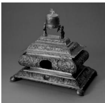
Šv. Juozapato Kuncevičiaus relikvijorius, Vilniaus katedros lobynas